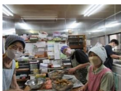
手慣れたボランティアさん、ありがとう！

短冊に願いを込めて祈ります「戦争のない平和な世界」を！ 朝からパラついてきた雨があがり、今日も月に一回カレーの日がやってきました。今日も笑顔のボランティアさんたちが、美味しいカレーを作ってくれました。大鍋2杯甘口と中辛のカレーです。今回は、たくさんの野菜や肉の寄付もありました。ありがとうございました。※皆様！カレー材料・お米のご寄付、ぜひともご協力お願いします。