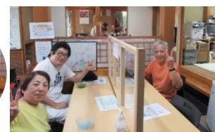
今日は定食じゃなくてカレー！