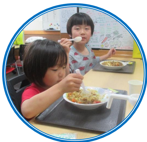
おいしそうに食べてるね♡