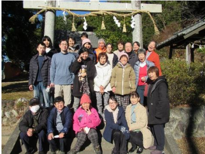
今年も近所の神社で初詣