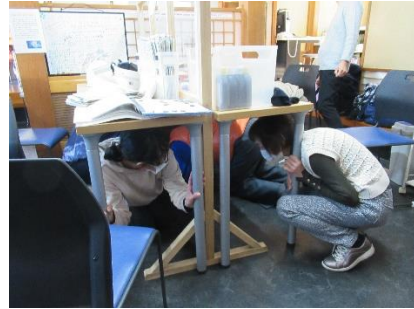
新年を祝う会でも防災訓練