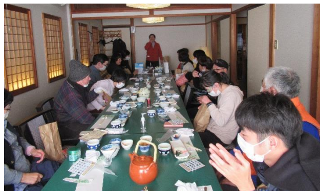
今年の会食は「お寿司」(福田寿司)