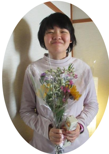
成人を祝う会 「おめでとうございます」