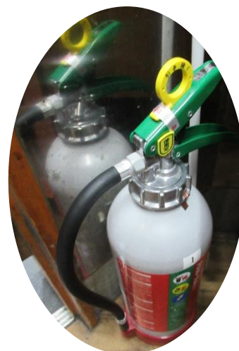
※キッチンの入り口に消火器が置いてあります