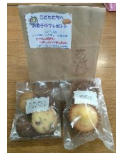
オール静岡さんからクッキーも♡