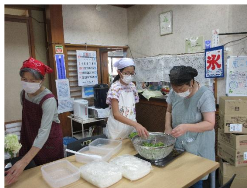
小学生ボラもお手伝いに！

香辛料のハウスギャバンさんが本格的なカレールーを寄付！いつもとはちょっと違うぞ！