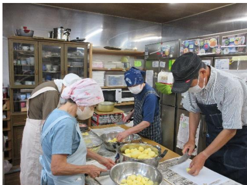
朝8時からカレーづくりスタート！

熱中症警戒情報や食中毒警報が出たりと、相変わらず毎日暑い日が続いていますが、今日も「おいでおいで食堂」には朝から元気の良い掛け声が響き渡っています。今日の辛口カレーは、本格的すぎてお子様にはちょっと辛すぎたかもしれません💦お許しください！でも、とっても辛くて美味しいカレーが出来上がりました。もちろん甘口だって負けてません。愛情込めて作りました！！