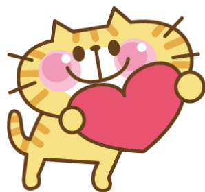
保護猫活動の紹介も

募金に呼んでくださった ロータリークラブのみなさま！ 会場に来てくださったみなさま 本当に、ありがとうございました！