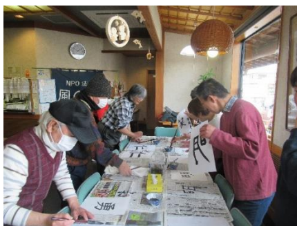
一生懸命に書きました