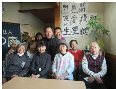
書初めの前で記念撮影