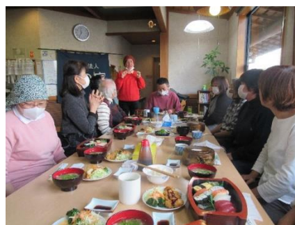
お昼は、美味しいお寿司で