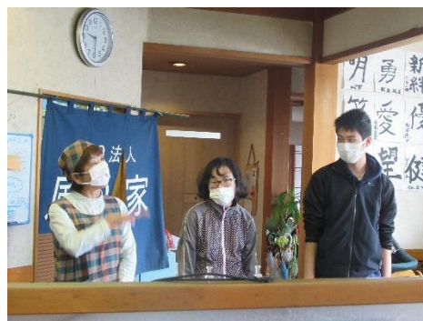
新職員と新利用者の挨拶