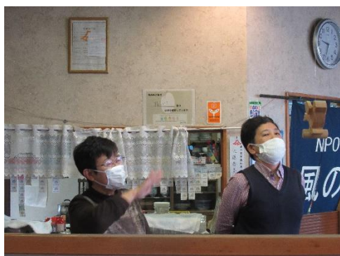
理事長挨拶・施設長

始めて社会に出る仲間2人と、新しい職員を迎え、形ばかりではありますが、入所式が行われました。高校を卒業して、胸がわくわくするのと、ドキドキするのと同じぐらいなのかもしれません。職員も同様、覚えることが山ほどあり、しばらくは余裕のない4月となるでしょう。でも、お互い頑張りましょう。