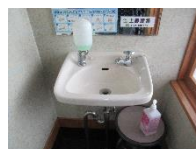
蛇口がかたく使いにくい。